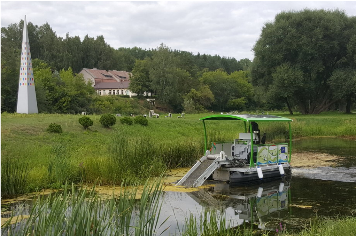
J. Sendžikaitė / Projekto „AlgaeService for LIFE“ metu sukurtas prototipas AS-S.